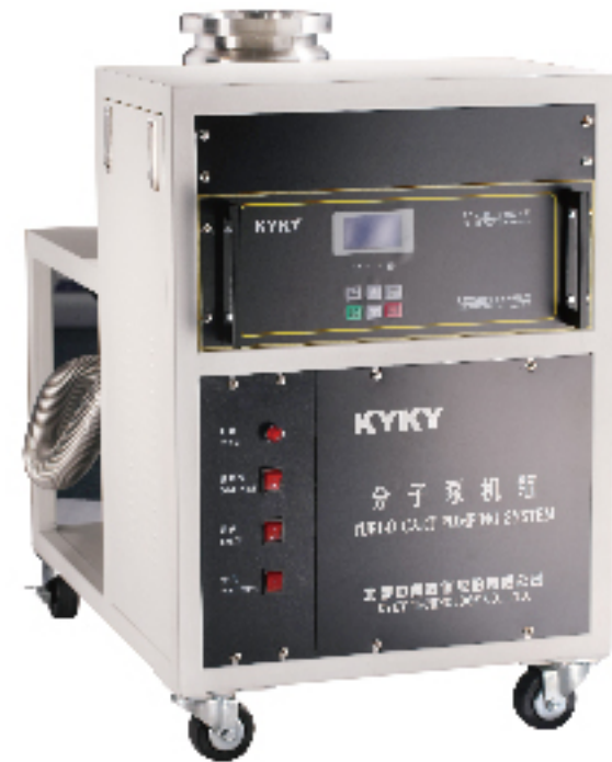
北京中科科仪股份有限公司 KYKY TECHNOLOGY CO., LTD.